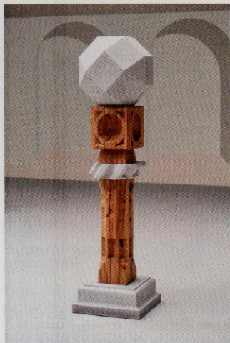
Raphaël Zarka, Mount Melville , 2018, éd. de 3 ex + 2 EA, chêne massif et béton fibré, 192 x 50 x 50 cm.

Sculpteur, Raphaël Zarka (1977) s'exprime également par la photographie, le dessin ou la vidéo. Déclinant le langage sculptural à travers les époques, il poursuit son exploration artistique, tout en questionnant les connaissances d'antan et savoirs ancestraux. Multipliant les sources d'inspiration, il revisite, tel un archéologue des formes, des géométries historiques en s'autorisant quelques