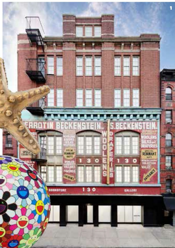
1 纽约贝浩登画廊正面

2018年下半年，贝浩登在上海落成画廊，空间坐落于外滩核心地带。虎丘路曾于1886年至1943年间被命名为“博物馆路”，至今仍是上海艺术生态圈的重要街区，与之邻近的艺术机构包括上海外滩美术馆、复星艺术中心、佳士得等。上海空间是贝浩登于亚洲的第四分支，也是其在亚洲最大的空间。新冠肺炎疫情暴发后为艺术市场带来很多不确定性，但随着内地对疫情的控制，上海的艺术市场迅速恢复。艾曼纽·贝浩登说，中国内地20岁末到40岁末岁的藏家最具购买力，他们对艺术的秉持开放的态度，喜欢在展览和艺博会寻找适合自己的作品。除了喜欢村上隆和丹尼尔·阿尔轩这类视觉丰富的艺术家作品外，年轻藏家更为讲究艺术品个人品味。四月，上海贝浩登画廊将举办法国艺术家Bernard Frize在国内的首次个展。