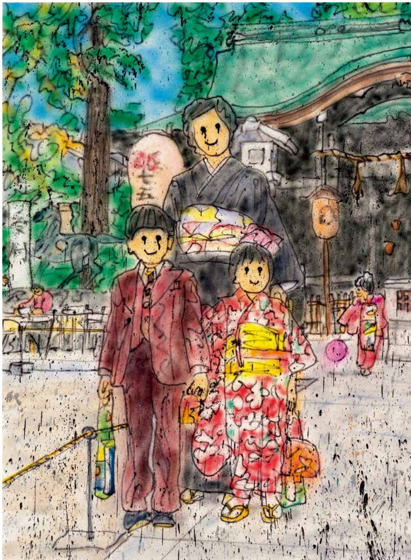
《753》，丙烯颜料，布面喷漆，160x120cm，2020 ©2020MADSAKI/Kaikai Kiki Co., Ltd. All Rights Reserved. Courtesy Perrotin