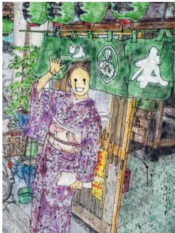
《我们的第二次约会》，丙烯颜料，布面喷漆， 160x120cm，2021

MADSAKI 1996年毕业于帕森设计学院 (Parsons School of Design)，可惜学生时代绘制的几何绘画并没有带给他灵感。数年之后他回到日本，放弃了笔刷，开始用喷漆创作以文字为基础的作品，阐述面对新环境产生的语言隔阂。与此同时，与他少年时代有关的 80 年代纽约的记忆挥之不去，特别是城市街道中的涂鸦和参观美术馆的经历，促使他创作出后来令其声名鹊起的“Wannabe's”系列。这一系列作品以喷漆形式重现古典和现代艺术杰作，让人过目难忘的笑脸便是他最具个人色彩的符号签名。“Wannabe's”最早于 2015 年在东京 Clear Edition 画廊展出，展出作品包括他重新诠释的达·芬奇的《蒙娜丽莎》，亨利·马蒂斯的《舞蹈》以及毕加索的《格尔尼卡》等。挑战经典权威的内容和喷漆涂鸦的形式立刻引起了艺术界的注意。