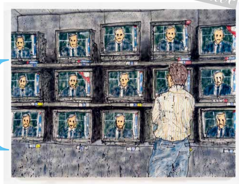
采访、编辑 | 荷大齐 撰文 | 莫迪