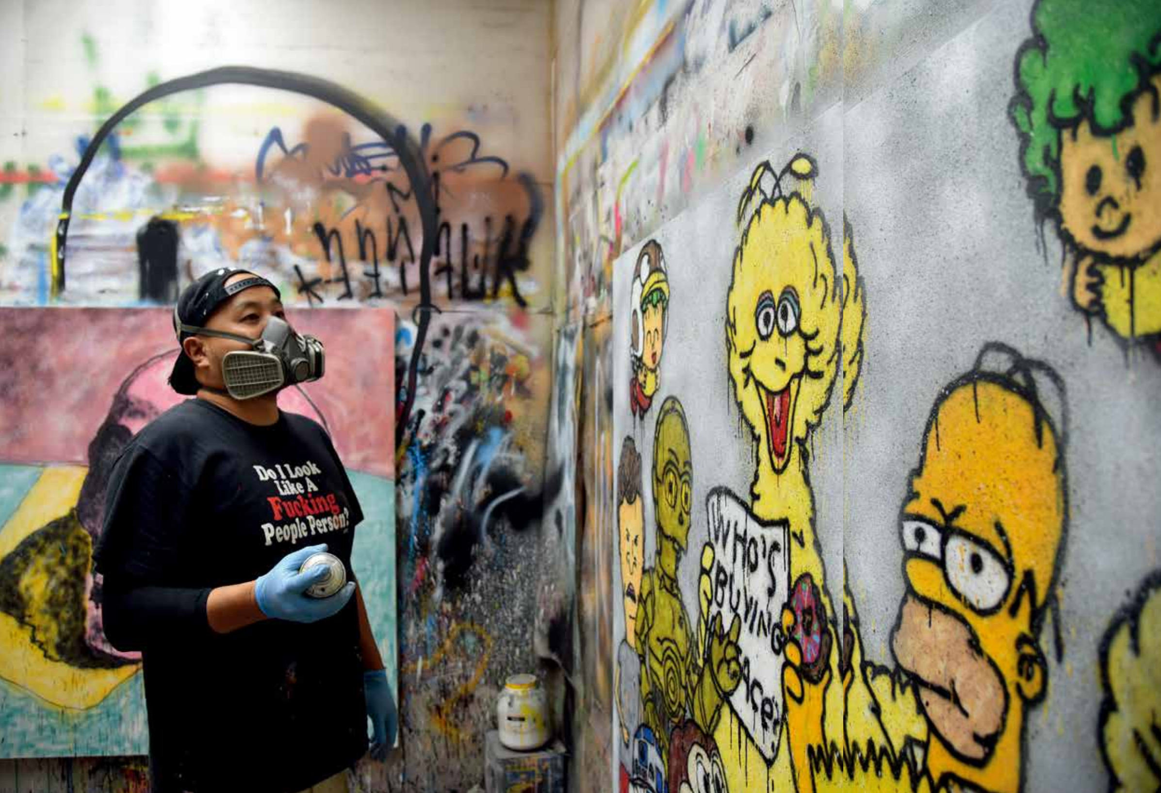
MADSAKI 肖像

A 无聊。无聊就是我最大的动力。我仍在考虑下一步如何去做。我需要休息一阵子，对休息产生无聊。BBART