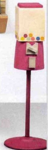
Ci-contre « Blow Out » de Genesis Belanger, avec Healthy Living , Impulse Buy et Three for One , 2022 ©PAULINE SHAPIRO & GALERIE PERROTIN, PARIS/NY.