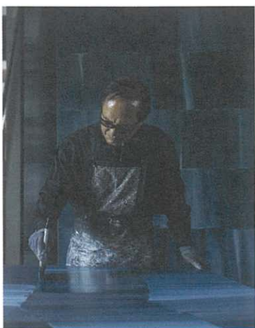
Portrait of Shim Moon-Seup