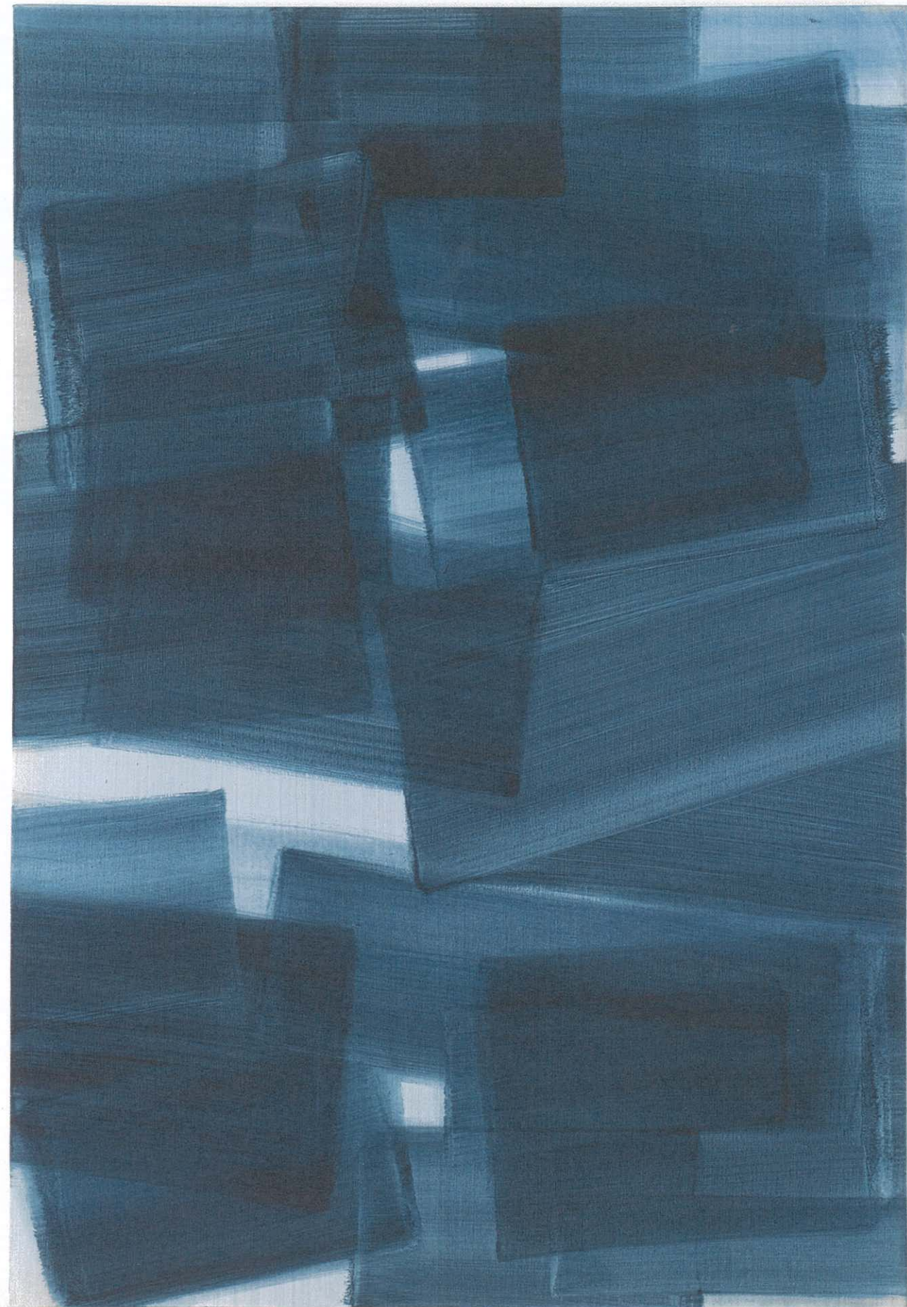
SHIM MOON-SEUP The Presentation , 2015 Acrylic on canvas 162.5 × 113 cm 64 × 44 1/2 in.