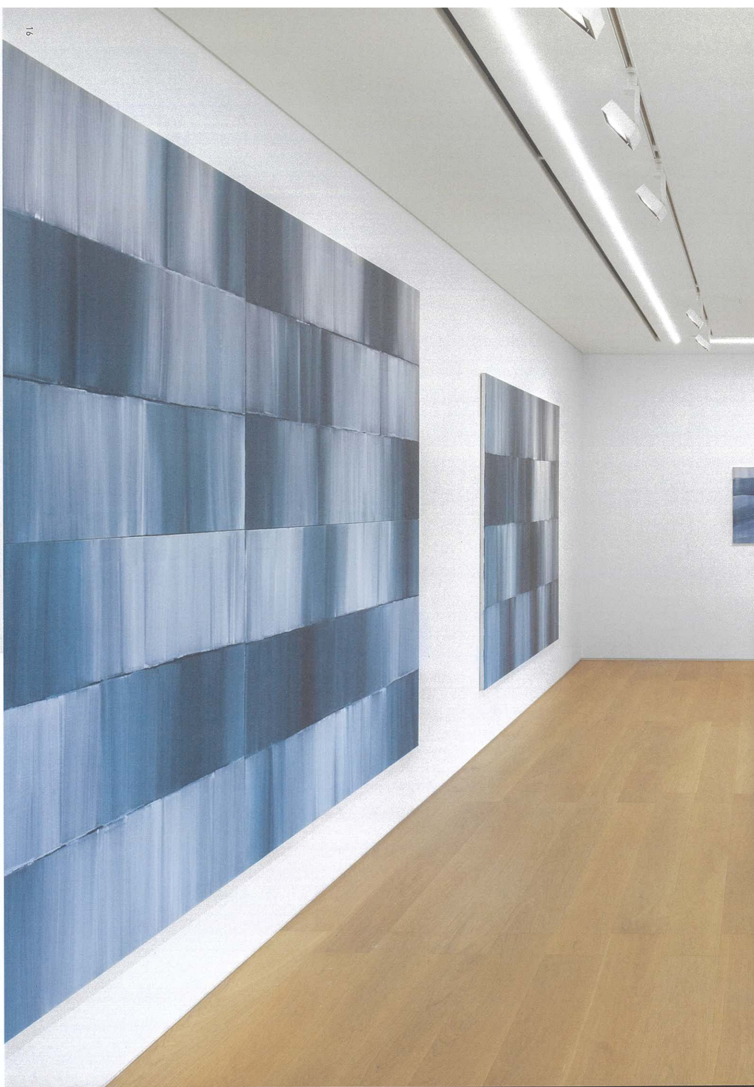
Installation view of 'Shim Moon-Seup: A Scenery of Time' at Perrotin Hong Kong, 2022