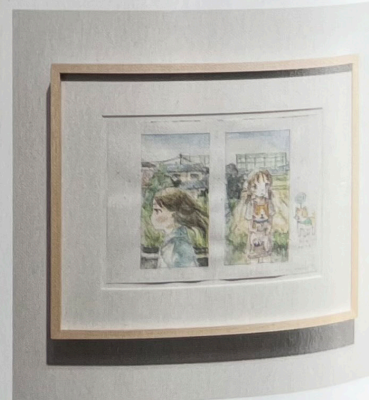
Emi Kuraya : Sans titre , 2020 Crayon et aquarelle sur papier 18,3 x 25,8 cm