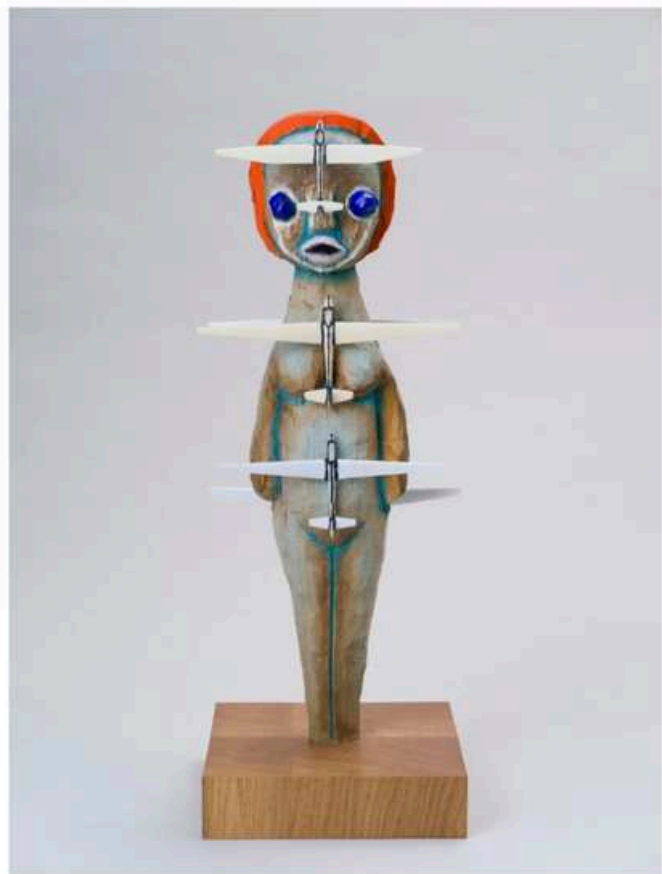
加藤泉，《无题》，2024年 丙烯颜料、木材、塑料模型、不锈钢、展示柜，66 × 25 × 24厘米（雕塑尺寸），163.1 × 52.2 × 52.2厘米（展陈尺寸）

走进贝浩登宽敞开阔的展位，仿佛进入了一个天真童趣、想象力烂漫的“前工业”宇宙：这个世界仿佛以植根于自然风土的民俗异志为主要知识形态，充斥着人与自然的幻化交互。代表性作品包括均来自日本、喜爱描绘“动物化”的孩童形象的加藤泉与三宅信太郎：前者创造的雕塑形象《无题》（2024）形似地母，身体上却缀饰着纤细的飞机这一工业造物，唤起自然崇拜的当代联想；后者绘画中则多见女童与马匹、自然女神嬉戏的场景，与同场展出的长井朋子《金色草地》（2025）及其他雕塑作品共振出一种仿佛要超越白盒子空间的自然生命力。