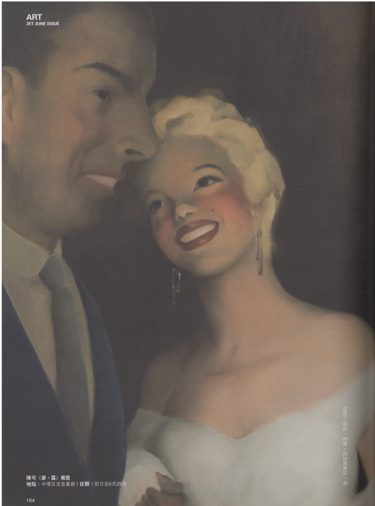
ART JET JUNE ISSUE