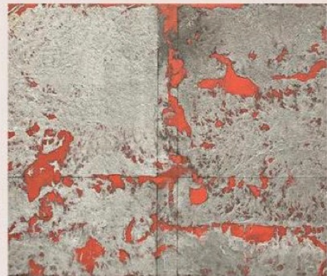
■作品是內心經由默想不斷過濾轉化後留下的純淨無垢的餘留，自有深層意義。

日期：即日起至12月21日 地點：中環干諾道中50號17樓 網頁： https://www.perrotin.com/