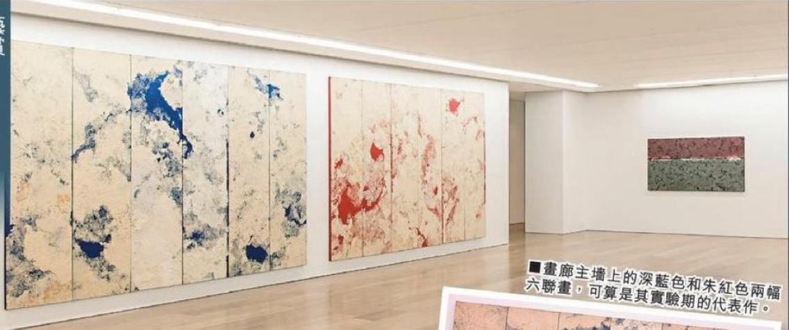
■畫廊主牆上的深藍色和朱紅色兩幅六聯畫，可算是其實驗期的代表作。