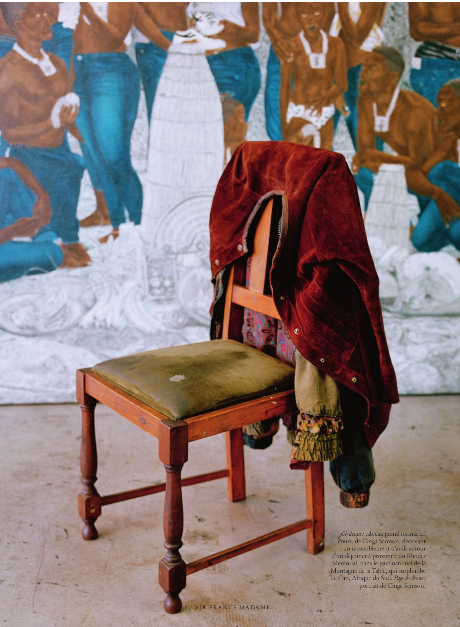
Ci-dessus : tableau grand format en cours, de Cinga Samson, décrivant un rassemblement d'amis autour d'un déjeuner à proximité du Rhodes Memorial, dans le parc national de la Montagne de la Table, qui surplombe Le Cap, Afrique du Sud. Page de droite : portrait de Cinga Samson.