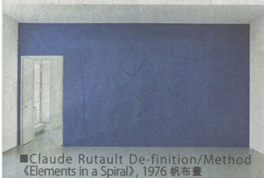
■ Claude Rutault De-finition/Method《Elements in a Spiral》, 1976 帆布畫

時間維度對 Claude Rutault 的作品極為重要，作品在時間運行的帶動下，由被動的展現，變得具有生命力，使作品更顯獨特。在44年間創作了654件作品，他不受畫布與牆壁規限，轉而透過文本開拓表現方式，例如把畫布擺放成拼圖(《Generalized Painting-puzzle》)；成堆的畫布倚靠牆壁、放在地上、從天花吊下(《Dream Canvases》)，甚至直接採用沒有上色的生麻布。表現方式也愈來愈複雜，有時需要幾個承傳者合作，以時空轉換(《AMZ》及《Im/Mobilier》)或承傳者的藏品作為素材。