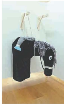
▲二〇一一年《Horse》，既是展品，又可隨意穿上。記者拍照時，另外兩件有觀眾「穿」在身上進展廳