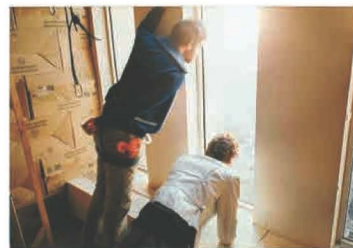
▲《Mona Lisa》- 11011年，Courtesy of the Artists and Galerie Perrotin ▲《The B-Thing》紀錄圖片，Courtesy of the Artists and Galerie Perrotin