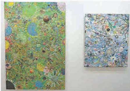
▲二〇一一年（左）、二〇〇七年的《Flower Painting》系列