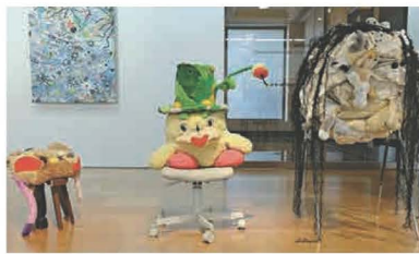
▲場內的椅子既是展品，亦可讓觀者隨意坐，甚至可以讓住家公仔觀展。（右一來自《Mona Lisa》系列創作）