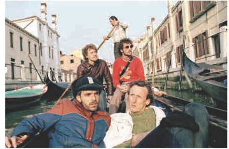
▲二〇〇一年奧地利藝術家團體Gelatin（〇五年後更名為Gelitin）於威尼斯