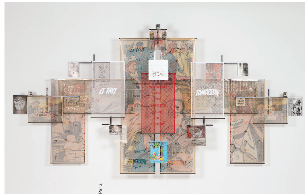
CLAIRE DORN; Cortesía de Iván Argote y Perrotin; cortesía de Iván Argote y Proyecto AMILL, Lima, Perú.