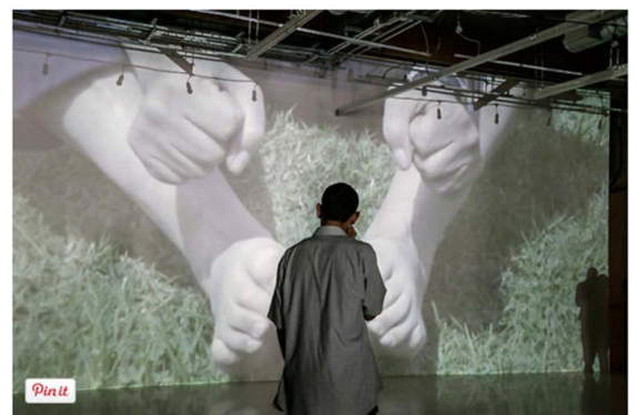
Somos tiernos de Iván Argote.