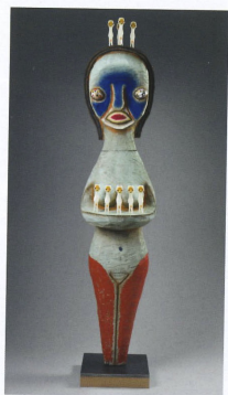
「無題」, 2017 木材、乙稀基、丙烯酸樹脂、 189 x 44 x 50 cm