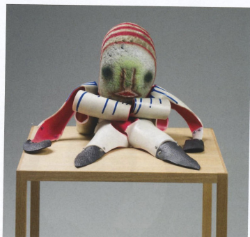
「無題」, 2017 石頭、乙稀基、丙烯酸樹脂、 86 x 40 x 56 cm