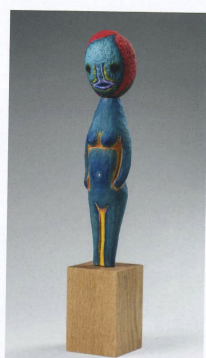
「無題」, 2017 石頭、木材、丙烯酸樹脂、 106 x 20 x 20 cm