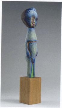
「無題」, 2017 石頭、木材、丙烯酸樹脂、 140 x 25 x 25 cm