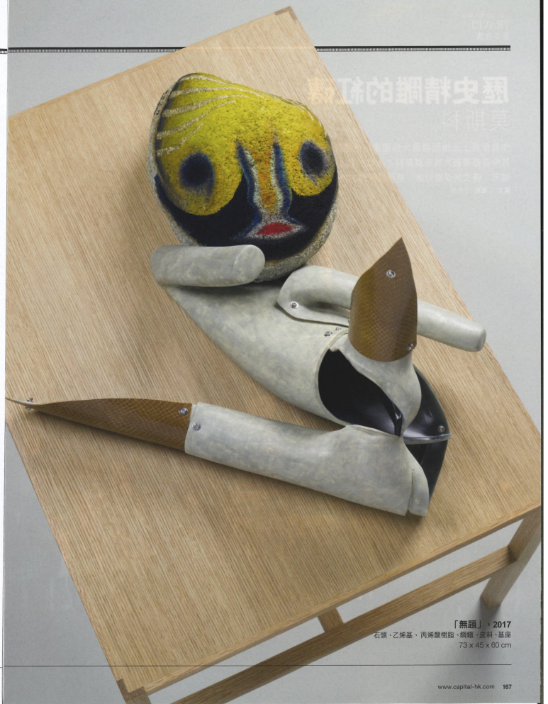
「無題」, 2017 石頭、乙稀基、丙烯酸樹脂、 73 x 45 x 60 cm