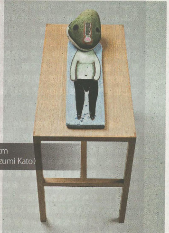
「Untitled」2017 (石頭、木材、亞克力、底座) 57.5 x 30 x 60 cm | 22 5/8 x 11 13/16 x 23 5/8 in (Photo: Kei Okano ©2017 Izumi Kato)

同時展出的紙本系列，部分以刺繡代替粉彩，增添了作品的層次，視覺上更加立體。這些立體「線條」不單豐富了意象，同時也帶出藝術家創作時的手工動感。