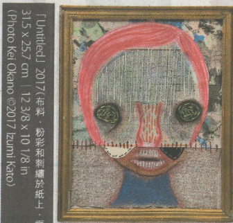
「Untitled」2017 (藝術家提供) 31.5 x 25.7 cm | 12 3/8 x 10 1/8 in (Photo: Kei Okano ©2017 Izumi Kato)