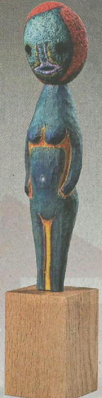
「Untitled」2017 (木材、木材、亞克力、鐵、底座) 106 x 20 x 20 cm | 41 3/4 x 7 7/8 x 7 7/8 in (Photo: Kei Okano ©2017 Izumi Kato)