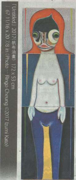
「Untitled」2017 (藝術家提供) 172 x 53 cm | 67 11/16 x 20 7/8 in (Photo: Ringu Cheung ©2017 Izumi Kato)