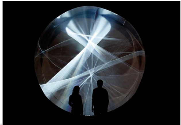
Continuel-lumière cylindre (Continuous Light Cylinder), 1962/2013.

Con más de 60 años explorando la perspectiva visual de la forma, el color y la luz, Julio Le Parc una vez más se sirve de los espacios contemplativos para dar a conocer las dimensiones de su arte cinético. Posicionado en el radar cultural-artístico desde hace ya muchos años, Le Parc es ahora el centro de atención en varias salas que comparten su trabajo cinético a través de una línea de tiempo que comprende material de archivo y piezas que datan de 1958 hasta el 2013.