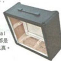
《Small Marshall Amp》，每件作品都是用畫布製成，幾可亂真。

生於日本沖繩縣，過往 25 年一直在洛杉磯生活及創作，先後於洛杉磯 California State University 取得文學士及美術碩士學位。他的雕塑畫尤為人所熟悉，透過模擬日常家居物品，為全球消費主義文化創造了共同語言。