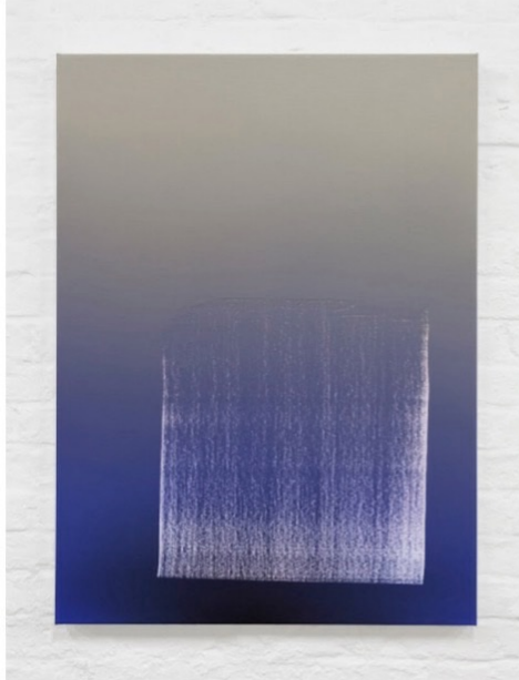
Untitled, 2015 Oil on canvas 76 x 56 cm / 30 x 22 1/16 inches

顏色對比、構圖比例、繪畫手法等等，這些都無不展現藝術家的個人特色和創作。多重顏色的概念展現的思維及情感，可以是精彩卻有混亂，也可以是充滿想像和思考的空間。