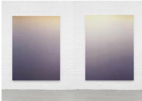
Untitled, 2015 Oil on canvas 230 x 170 cm / 90 1/2 x 67 inches

比利時藝術家 Pieter Vermeersch 一點也不貪心，單一顏色的運用足再展色彩。單色美學的概念背後並非憑空思考，而是寫實相片作為依據。真是景象透過正片、負片、分格、配色，把實體意象重現，平衡抽象與具象的意象，更在風格上展現色域繪畫及極簡主義。