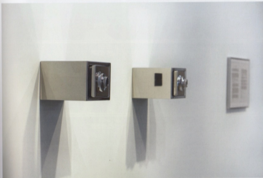
Secret (detail), 2014 Two safes, engraved plaques, framed contract 15 x 20 x 20 cm (each safe), 7 x 10 x 0.3 cm (plaque), 35.2 x 47.5 x 2 cm (contract)

Find a couple. Have each of them tell me a secret. Install two safes in their home. Lock each secret up in its own safe. Keep the codes to myself. The lovers will have to live with the other's secret close at hand but out of reach.