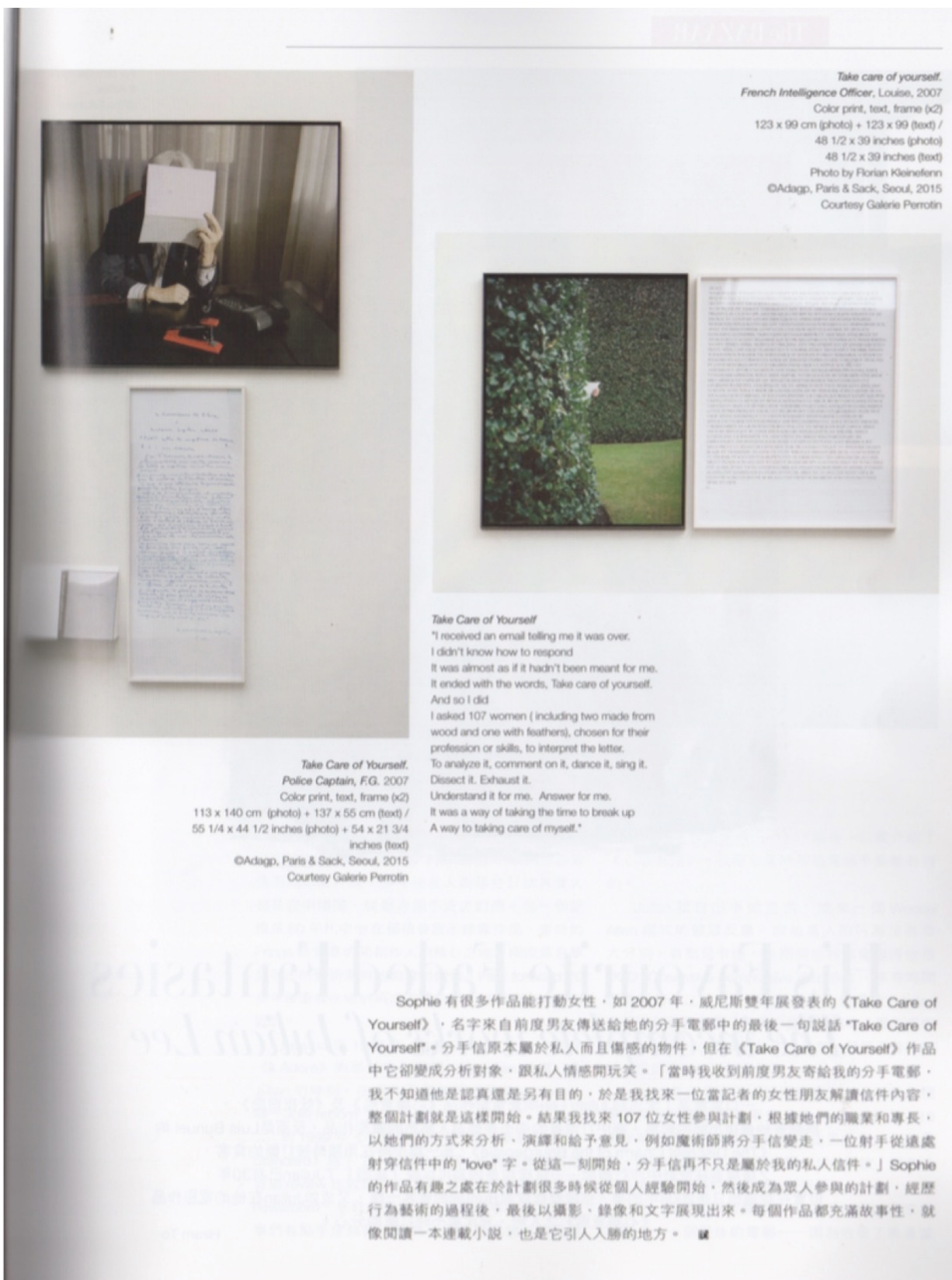
Take care of yourself. French Intelligence Officer, Louise, 2007 Color print, text, frame (x2) 123 x 99 cm (photo) + 123 x 99 (text) / 48 1/2 x 39 inches (photo) 48 1/2 x 39 inches (text)