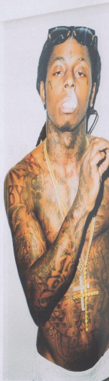
Terry Richardson (Portraits) 展覽日期：即日起至3月12日 地點：貝浩登畫廊(中環干諾道中50號17樓)