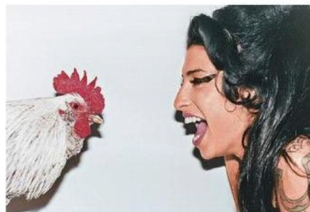
◀ Amy Winehouse, 2007