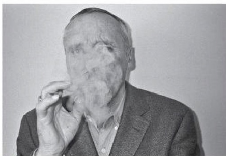
◀ Dennis Hopper, 1999