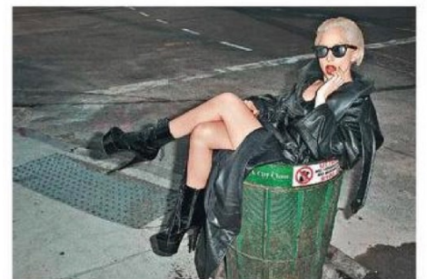
◀ Gaga in the Garbage , 2010