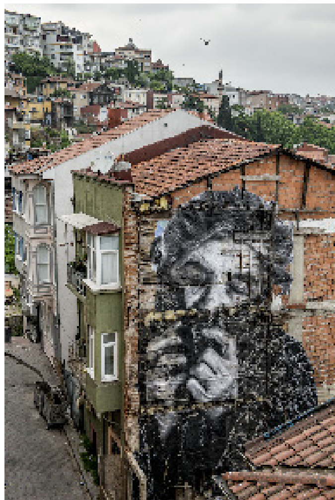
« The Wrinkles of the city, Istanbul, Ayse Vural, Turkey, 2015 » Color print, mounted on dibond, plexiglas, chassis bois affleurant. 180 x 120 cm / 70 7/8 x 47 1/4 in

Bien sûr, eux-mêmes ont une vision altérée de leur parcours. Rares sont ceux qui n'étaient pas du bon côté de l'Histoire parmi les personnes