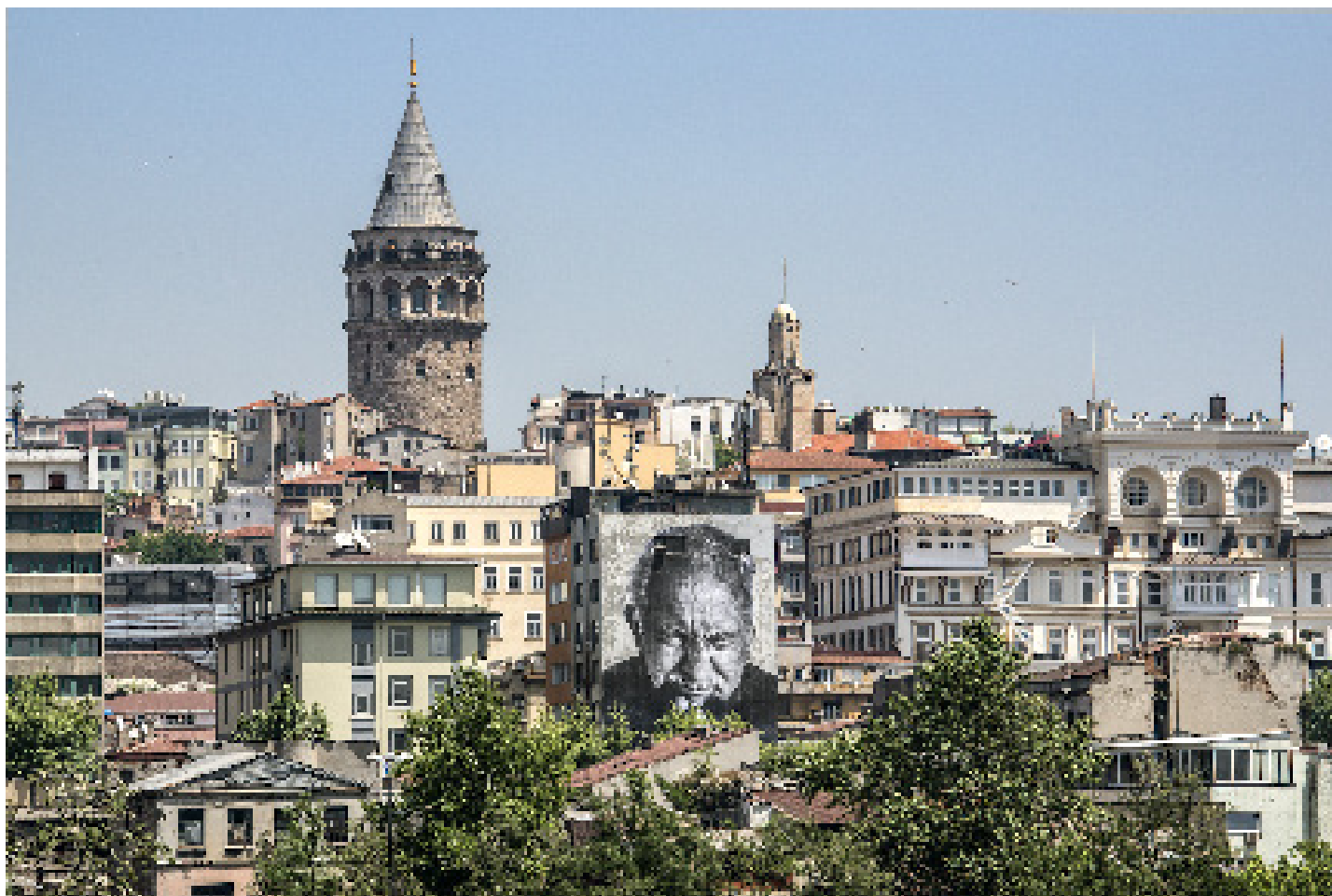
« The Wrinkles of the city, Istanbul, Ismet Erkoç, Turkey, 2015 » Color print, mounted on dibond, plexiglas, chassis bois affleurant. 125 x 187,5 cm / 49 3/16 x 73 13/16 in

« WRINKLES of The CITY Istanbul » Un projet de JR, un film de Guillaume Cagniard Projection du 16 mars au 13 mai 2017 Galerie Perrotin, Paris / Vernissage : Jeudi 16 mars, 16h-21h