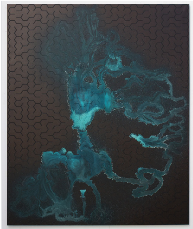
Michael SAILSTORFER, "Maze 73" 2013 Sérigraphie acrylique, acide et peinture bronze sur toile / Acrylic screen print and acid on iron primed canvas; 230 x 190 cm / 90 1/2 x 74 3/4 inches