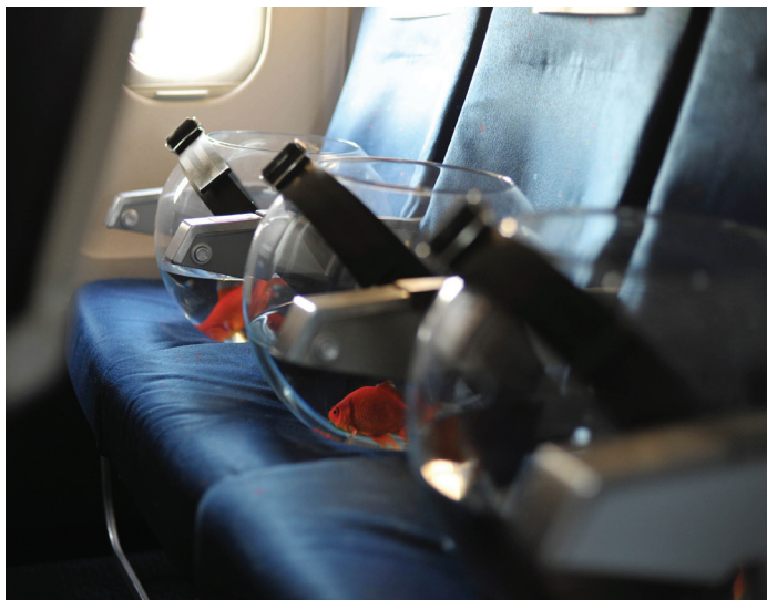
Sans titre, 2009 Tirage photographique, aluminium, verre, cadre