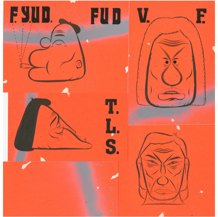
©Barry McGee. Courtesy of the artist and Perrotin.