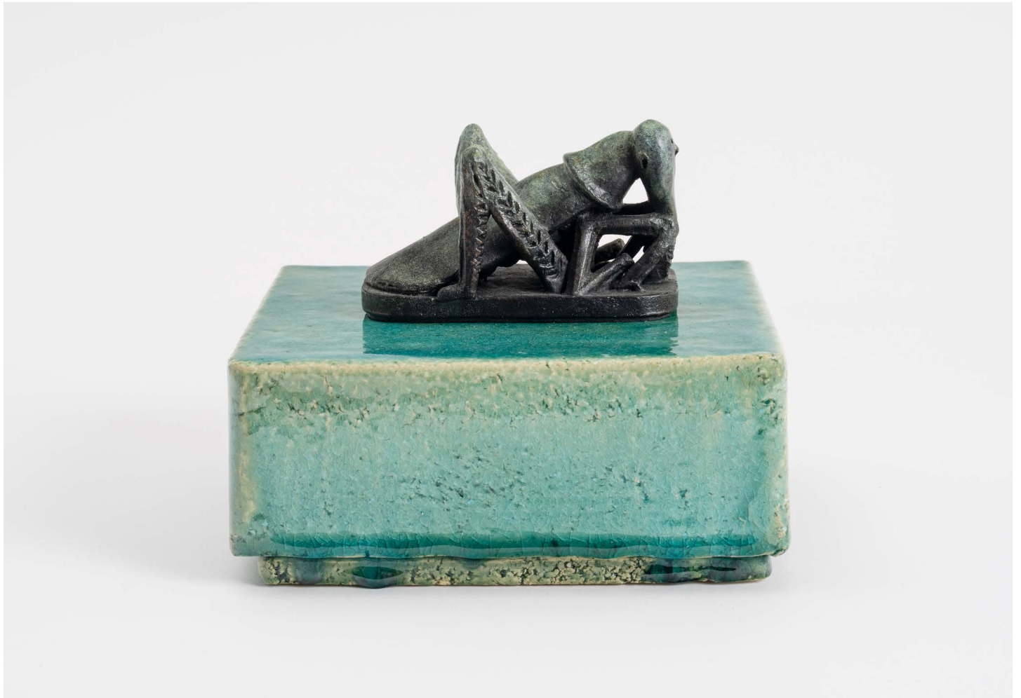
Johan Creten, La Sauterelle - Library version , 2023. Bronze. 7 × 11 × 7 cm | 2 3 / 4 × 4 5 / 16 × 2 3 / 4 in. Photo: Claire Dorn. ©Johan Creten / ADAGP Paris, 2023. Courtesy of the artist and Perrotin.