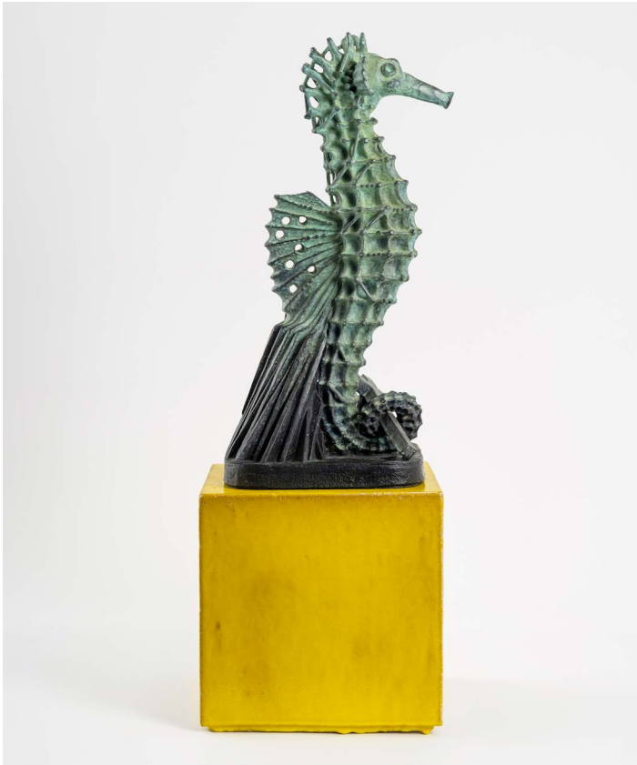
Johan Creten, L'Hippocampe , 2023. Bronze. 60 × 26 × 33 cm | 23 5/8 × 10 1/4 × 13 in. ©Johan Creten / ADAGP Paris, 2023.