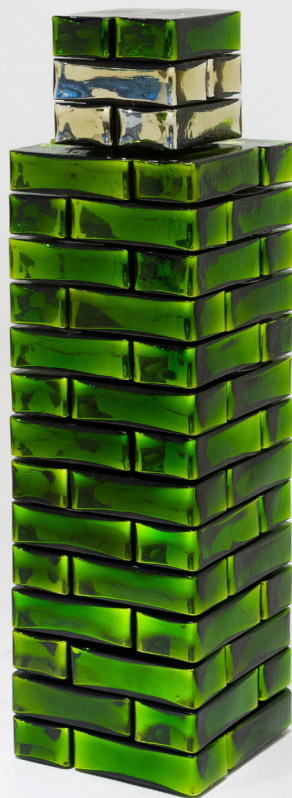
Jean-Michel Othoniel, Wonder Block , 2024. Light green and champagne Indian mirrored glass, stainless steel / Verre indien miroité vert clair et champagne, inox. 120 × 33 × 33 cm | 47 1/4 × 13 × 13 in. Photo: Claire Dorn. ©Jean-Michel Othoniel / ADAGP, Paris, 2025. Courtesy of the artist and Perrotin.

Les murs sont érigés pour diviser et contenir, comme cela a été le cas à Berlin, mais peuvent aussi devenir des lieux et des symboles de rassemblement, de prière et de manifestation, comme le Mur des lamentations, le Mur de la démocratie de Xidan, ou le mouvement de Stonewall. Si l'on examine la portée significative des murs dans les différentes cultures, il n'est pas surprenant de constater que la grille est un sujet récurrent dans l'art moderne, attirant des artistes qui consacrent leur carrière entière à sa forme qui semble rigide et répétitive. Un mur représente à la fois une fin et un début, un seuil où cesse l'effort physique et où commence l'hallucination, se transformant en écran pour des projections collectives.