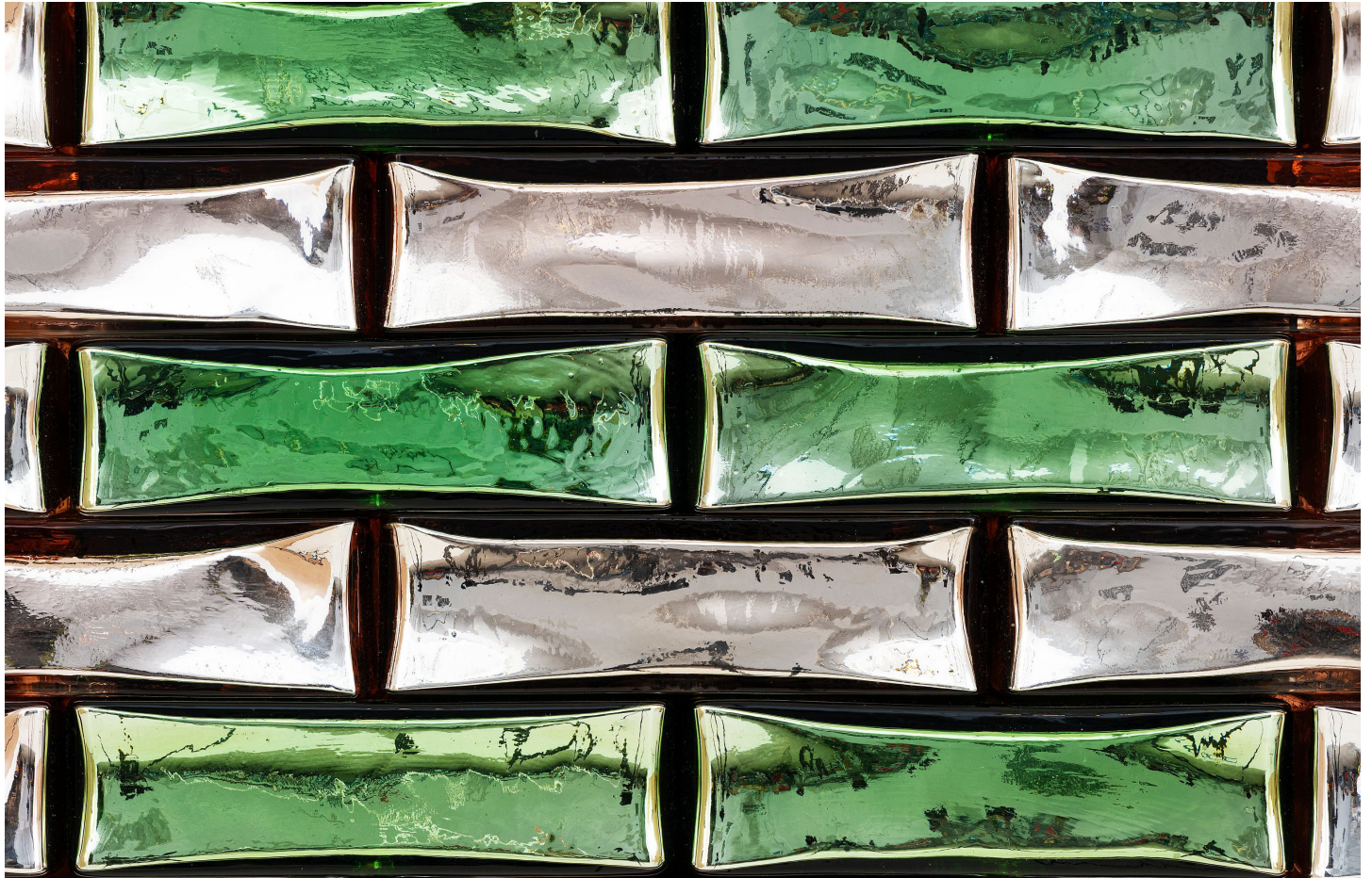
Jean-Michel Othoniel, Precious Stonewall , 2025. Powder pink and light green Indian mirrored glass, wood / Verre indien miroité rose poudré et vert clair, bois. 85 × 66 × 22 cm | 33 7 / 16 × 26 × 8 11 / 16 in. Photo: Claire Dorn. ©Jean-Michel Othoniel / ADAGP, Paris, 2025. Courtesy of the artist and Perrotin.