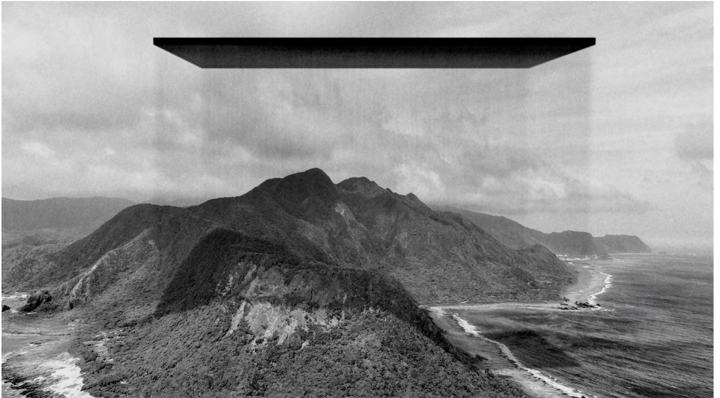
Laurent Grasso, Stills of Orchid Island , 2023. HR film, 19' 14". ©Laurent Grasso / ADAGP Paris, 2023. Courtesy of the artist and Perrotin.