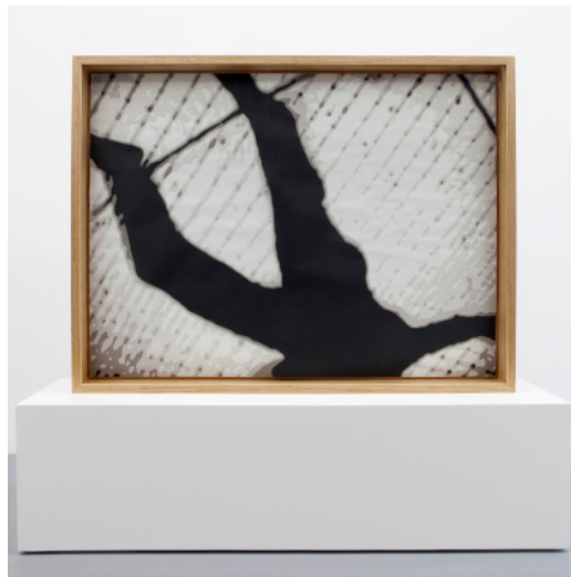
Xavier Veilhan, Free Fall n°1 , 2011 Papier, aiguilles, bois, verre ; 113 x 148 x 11 cm © Veilhan / ADAGP, Paris, 2024