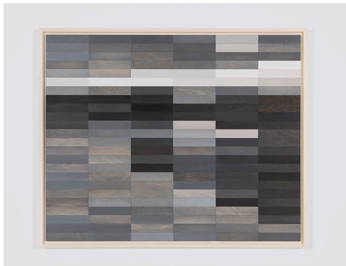
Xavier Veilhan, Paysage n°7 (Cap Coz) , 2024 Contreplaqué de Bouleau, sycomore, peinture acrylique / Birch plywood, sycomore, acrylic paint ; 61 x 74 x 3 cm / 24 x 29 1/8 x 1 1/8 inches © Veilhan / ADAGP, Paris, 2024