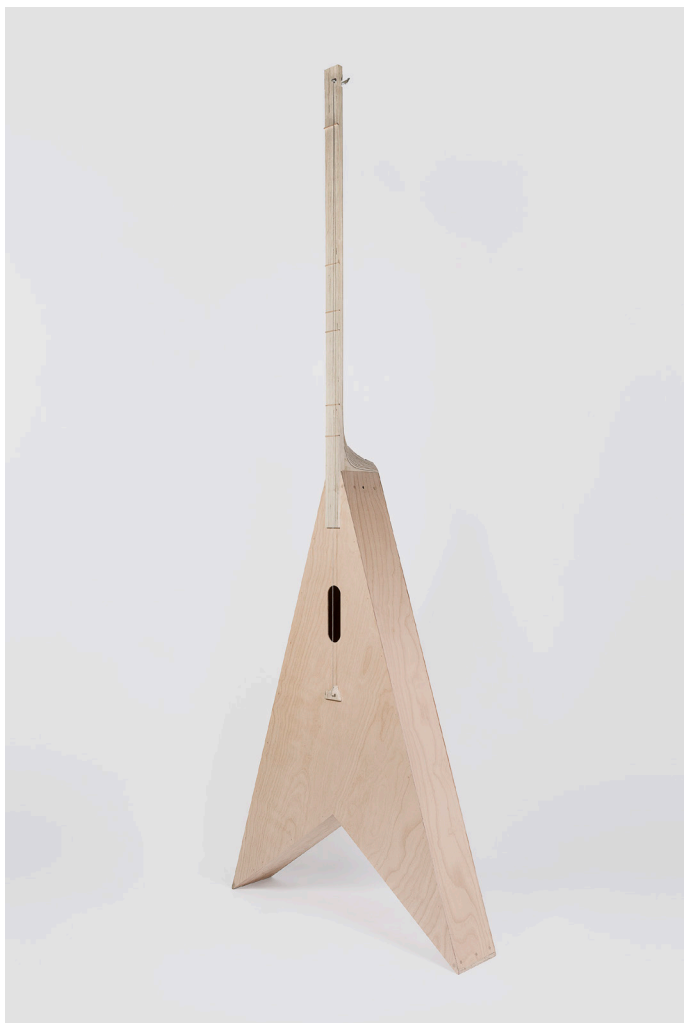
Xavier Veilan, Instrument n°7 , 2022 Contreplaqué de hêtre, contreplaqué de bouleau, matériaux divers / Beech plywood, birch plywood, various materials ; 331 x 122 x 23 cm / 130 3/8 x 48 x 9 inches © Veilhan / ADAGP, Paris, 2024