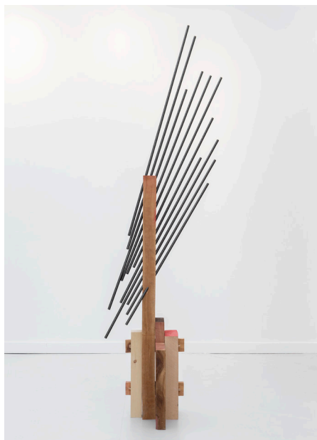
Xavier Veilhan, Le Stable n°1 , 2015 Bois, carbone, peinture ; 262 x 85 x 75 cm © Veilhan / ADAGP, Paris, 2024