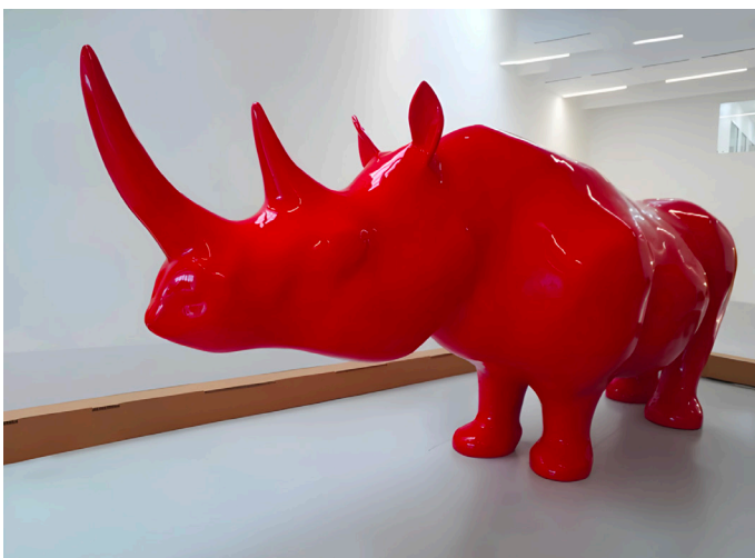
Xavier Veilhan, Le Rhinocéros, 1999-2000 Résine polyuréthane, fibre de verre, résine polyester, peinture polyester 170 x 140 x 415 cm Prêt du Centre Pompidou