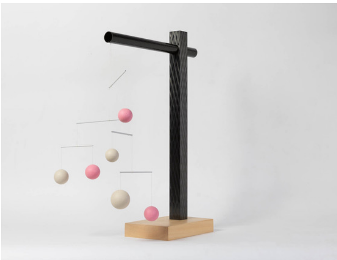
Xavier Veilhan, Mobile n°8 , 2016 Acier inoxydable, carbone, hêtre, lin, peinture acrylique 60,5 x 153 x 132 cm Courtesy de l'artiste et Perrotin Photo © Émilie Mathé Nicolas / ADAGP, Paris, 2024 © Veilhan / ADAGP, Paris, 2024