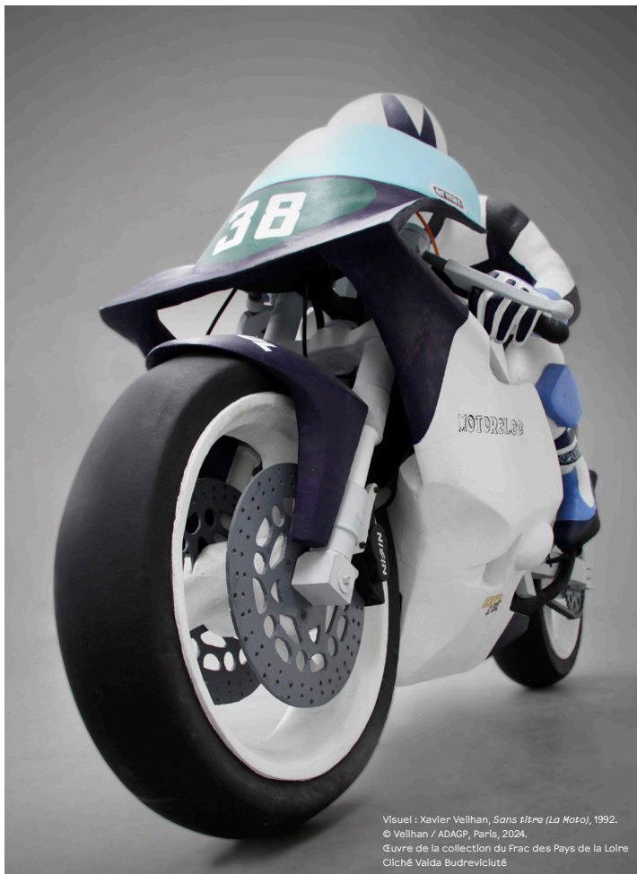
Visuel : Xavier Veilhan, Sans titre (La Moto) , 1992. © Veilhan / ADAGP, Paris, 2024. Œuvre de la collection du Frac des Pays de la Loire