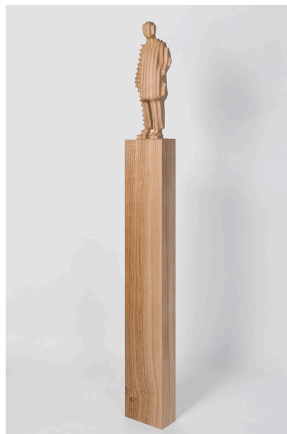
Xavier Veilhan, Constance No3 , 2024 Chêne / Oakwood ; 140 x 20 x 13 cm / 55 1/8 x 7 7/8 x 5 1/8 inches. © Veilhan / ADAGP, Paris, 2024