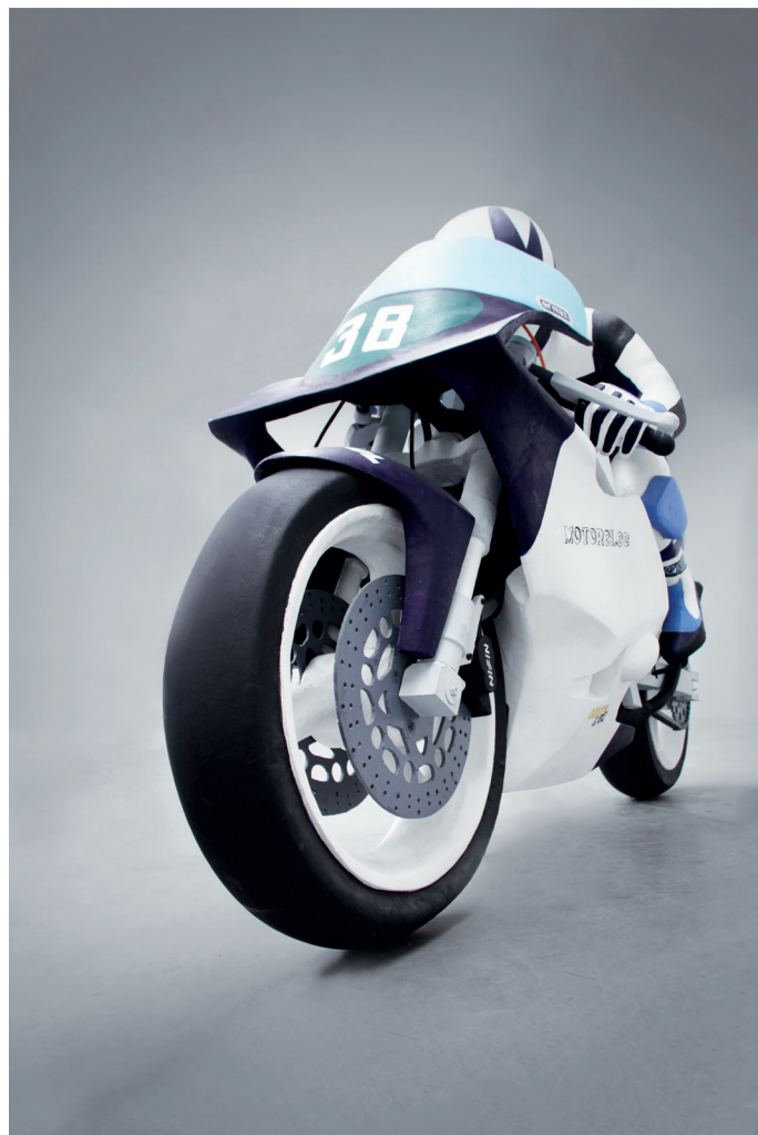
Xavier Veilan, Sans Titre (La Moto) , 1992 Mousse polyuréthane, bois, PVC, résine polyester, peinture 130 x 200 x 70 cm Œuvre réalisée dans le cadre des IX e Ateliers Internationaux du Frac des Pays de la Loire Acquisition en 1993 Collection Frac des Pays de la Loire