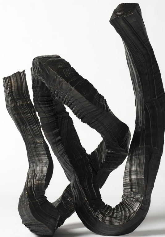
Lee Bae, Brushstroke S6 , 2025. bronze. 106 × 62 × 56 cm.