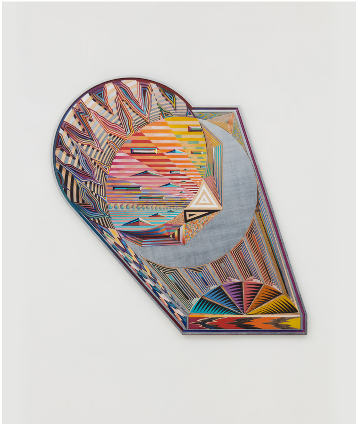
Zach HARRIS, Eclipse Eye , 2018. Carved wood, water-based paint, ink. 99.1 x 91.4 cm | 39 x 36 in.