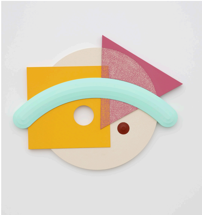
Peeping Tom , 2019. Acrylic on canvas, acrylic on panel. 84 x 106 cm