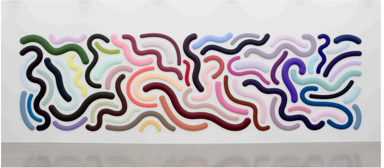
Summertime A, B, C, D, E, 2019. Acrylic on canvas. Dimensions variable.