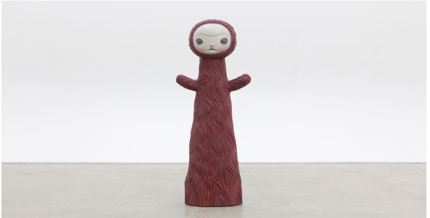
Mark Ryden, Yakalina (Blood) , 2022. Bronze with patina. 105 × 43 × 33 cm | 41 × 17 1 / 2 × 13 1 / 4 inch.