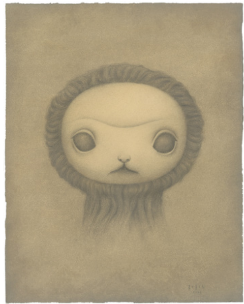
Mark Ryden, Yakalina Portrait , 2022. Mixed media on paper. Unframed: 54.6 × 43.2 cm | 21 1/2 × 17 inch.

り、鑑賞者を未知なる世界へと導き入れ、創造的な精神を引き出すとともに、私たちと自然や神性との繋がりを再発見させます。ライデンは「あなたが望むなら、アニマル・スピリットはあなたの元を訪れます。目を閉じ、心の内側に目を向け、あなたを導く動物に呼びかけたら、目を開け、来訪を待つのです」と語ります。