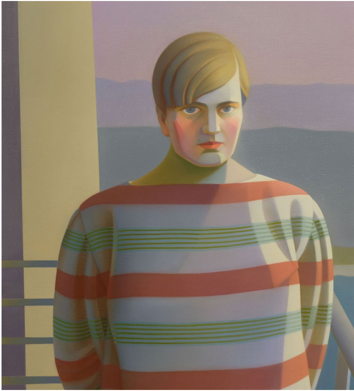
Chen Ke, Bauhaus Gal N°17 -- Marianne Brandt II , 2022. Oil on canvas. 160 x 120 cm | 63 x 47 1/4 inch. Courtesy of the artist and Perrotin.