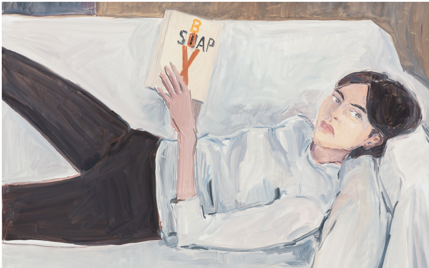
Jean-Philippe Delhomme, Shelim , 2021. Oil on canvas, 114 × 152 cm. Courtesy of the artist and Perrotin.