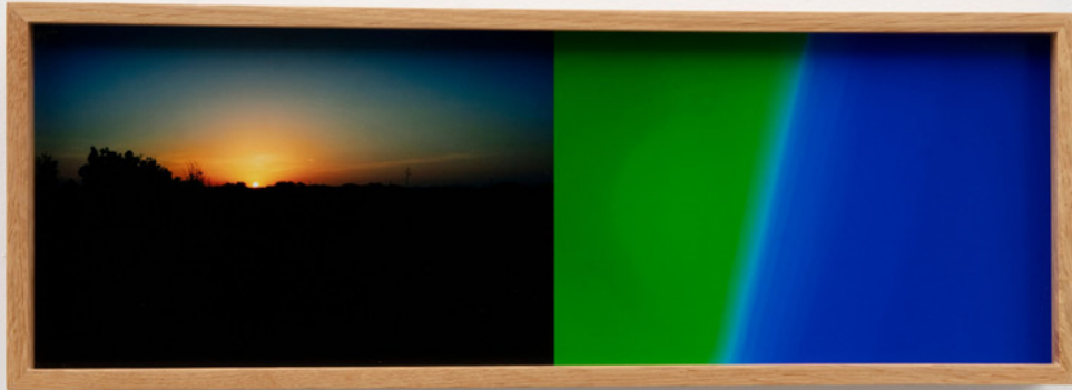
Leslie Hewitt, Daylight/Daylong 007 , 2021. Digital chromogenic print. 16.8 × 52.1 cm | 6 5/8 × 20 1/2 in.