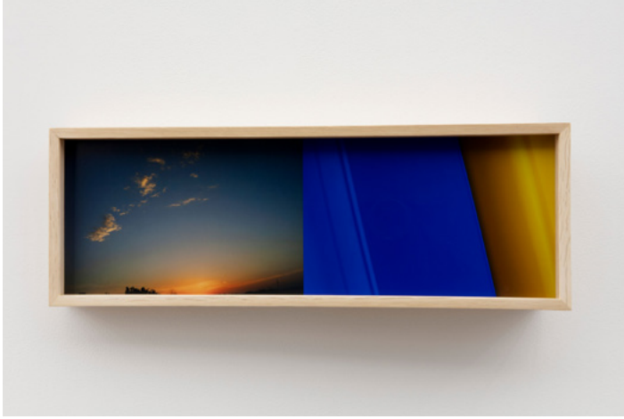
Leslie Hewitt, Daylight/Daylong 002 , 2021. Digital chromogenic print. 18.4 × 51.8 × 10.2cm | 7 1/4 × 20 3/8 × 4 in.