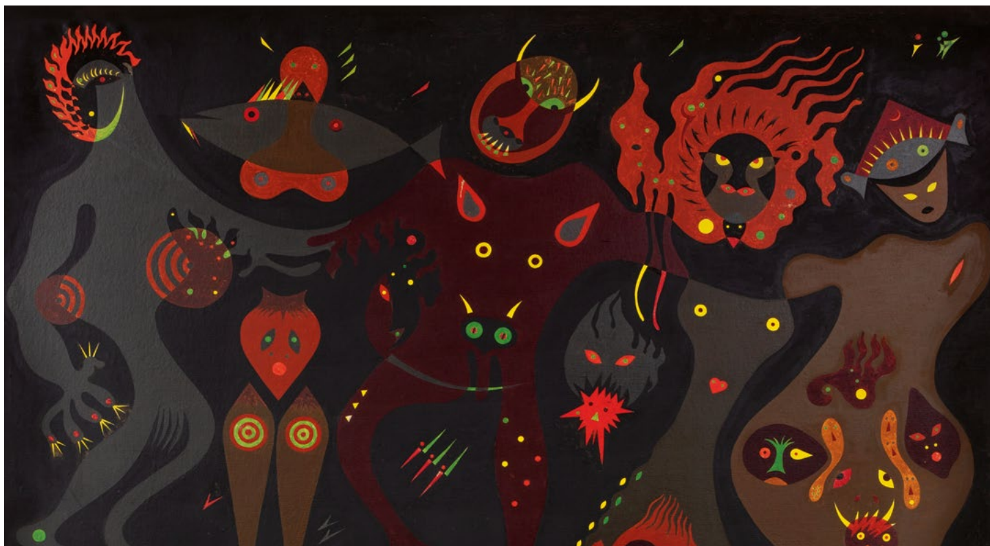
Yves LALOY, Homme âgé à Dante (detail), 1954, Oil on canvas, 169 x 208 cm | 66 9/16 x 81 7/8 inch, Unique.